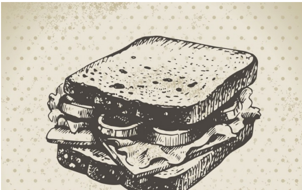
Enric Calpena / Getty Images

Se'n sap el dia i, fins i tot, l'hora: a les cinc de la matinada del 6 d'agost de 1762, el comte de Sandwich, John Montagu, va tenir un atac de gana. Estava jugant a cartes al seu palau d'Anglaterra amb uns amics i el renou de l'estómac no el deixava concentrar-se. Va demanar al seu criat que li preparàs un àpat que es pogués anar menjant mentre jugava, sense utilitzar forqueta i sense embrutar-se les mans: dues llesques de pa i, enmig, uns talls del rosbif (carn de bou lleugerament rostida) de la nit anterior. Aquell invent tan singular es va anar coneixent com un sandwich , pel títol del «suposat» creador.